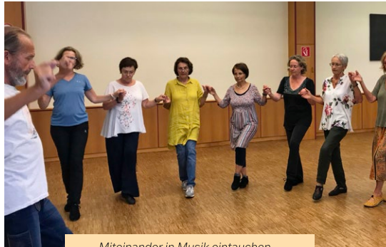
Miteinander in Musik eintauchen

Seit diesem Kurs in Puchberg ist Tanzen im Kreis für mich eine Kraftquelle geworden. Auch wenn ich müde, abge-