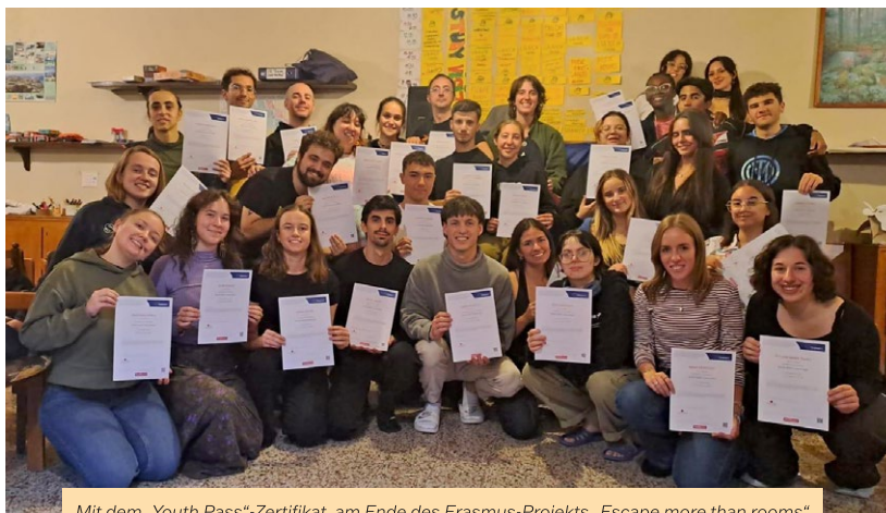
Mit dem „Youth Pass“-Zertifikat, am Ende des Erasmus-Projekts „Escape more than rooms“ zum Thema „Migration in Europa“.

Als Dankeschön für den Einsatz und die vielen freiwilligen Stunden ließen wir das Projektjahr entspannt ausklingen: Bei einem gemeinsamen Ausflug ins Aquapulco im Februar. Ein gelungener Abschluss für ein Jahr voller Engagement, Gemeinschaft und Erinnerungen.