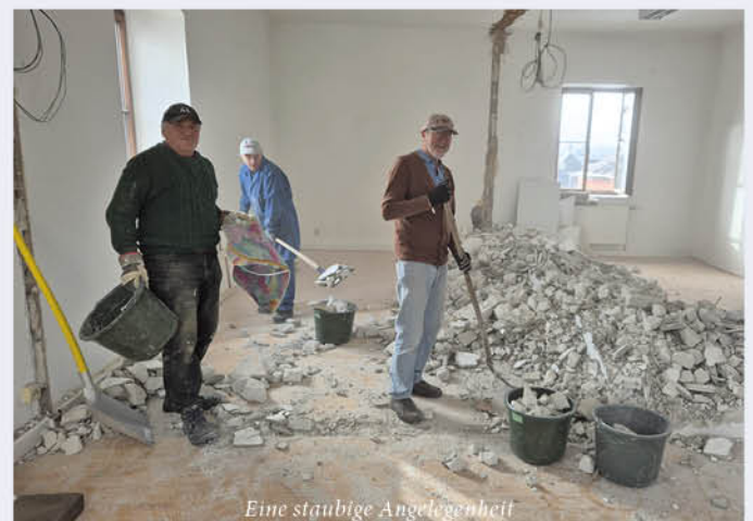
Eine staubige Angelegenheit