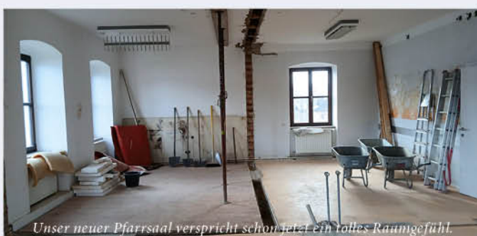
Unser neuer Pfarrsaal verspricht schon jetzt ein tolles Raumgefühl.