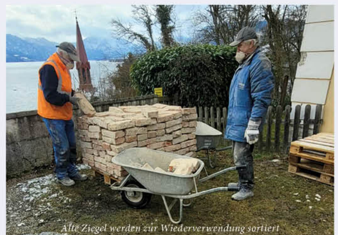
Alte Ziegel werden zur Wiederverwendung sortiert