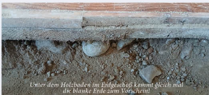
Unter dem Holzboden im Erdgeschoss kommt gleich mal die blanke Erde zum Vorschein!

Ihr Bauteam der Pfarrgemeinde Maria Attersee