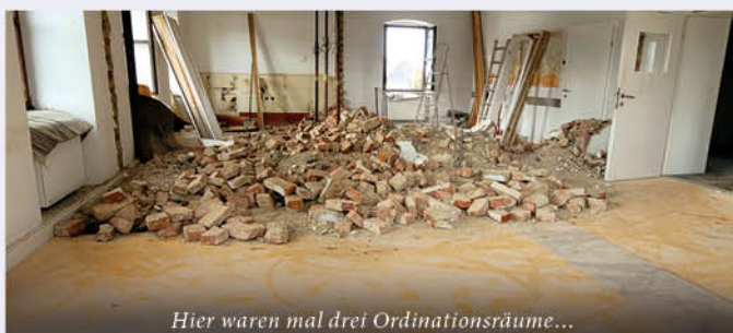
Hier waren mal drei Ordinationsräume...