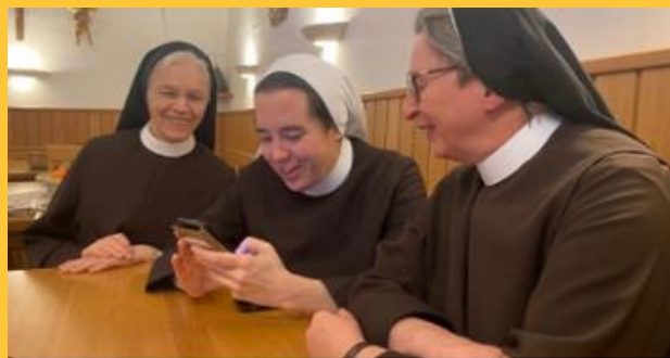
Ein Blick hinter den Schleier