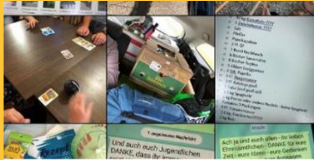
Evangelium und Social Media?!