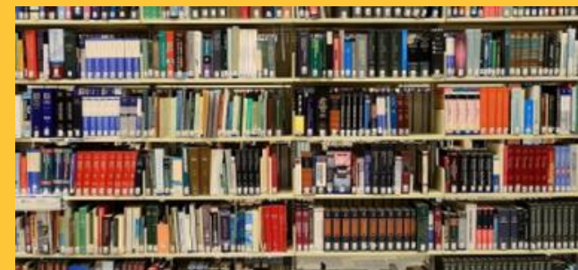
Expedition in die Welt der Bücher