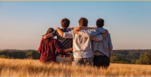
Kirche und junge Menschen - (k)ein Widerspruch