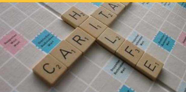
Create future! - Young Caritas