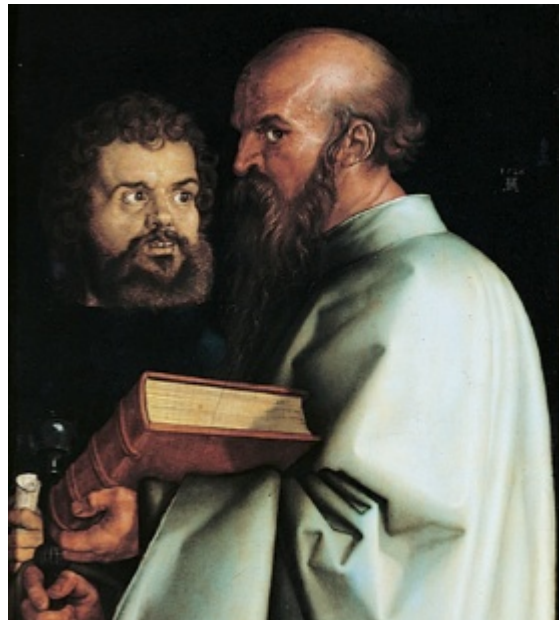
Albrecht Dürer, Apostel Paulus und Evangelist