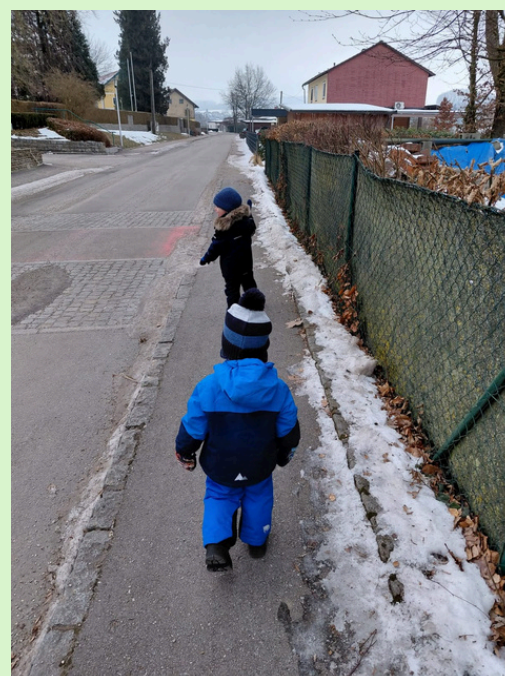
M. und M. sowie E. und M. beim Schnuppervormittag vergangenen Winter