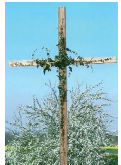
Kreuz am Dorf- platz in Berg

20.00 Uhr: Osternachtsfeier mit musikalischer Ge- staltung durch das BergWerk (Kerzen mitbringen) Die Katholische Frauenbewegung verkauft Osternachtskerzen und verteilt gesegnete Taufwasserfläschchen an die Kirchen- besucher:innen – Speisensegnung