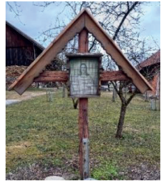
Kreuz bei Familie Lichtenberger, Bauschmied in Nettingsdorf

Wir gehen ca. 5 km, teilweise auf Feldwegen (zusätzlich 2 km für alle, die nach Berg zurückgehen). Weitere Infos bei Karl Greul, Tel. 0650 5461428