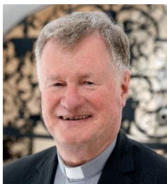
Bischof Manfred Scheuer

Eine herzliche Einladung an alle, diese Gelegenheit zur Begegnung mit dem Bischof und dem Visitationsteam im Oktober wahrzunehmen.