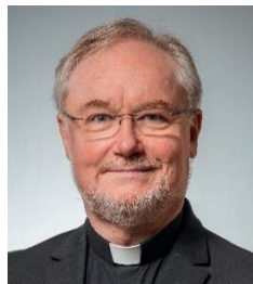
Generalvikar Severin Lederhilger