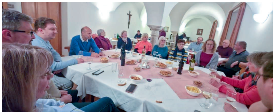
Das BergWerk beim Chorwochenende in Steinerkirchen. Nach der intensiven Probenarbeit blieb am Abend noch Zeit für geselliges Beisammensein.

Der Kinderchor probt ebenfalls bereits fleißig für seinen nächsten Auftritt. Beim Gottesdienst mit Fahrzeugsegnung am 5. Juli wirkt der Kinderchor musikalisch mit.