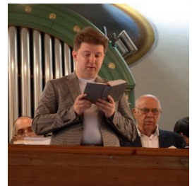
Beim feierlichen Gottesdienst zum Patrozinium in der Kirche Berg.