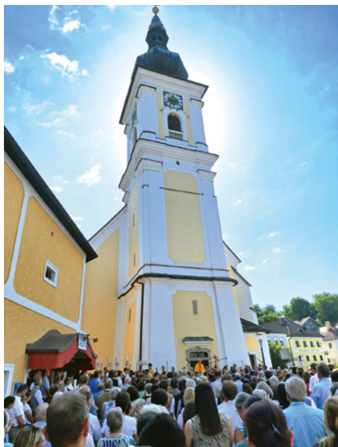
Festmesse beim Pfarrgründungsfest der Pfarre Almtal am Pfingstmontag in Vorchdorf

Pfarrkurat P. Tassilo und Seelsorgeteammitglied Renate Bruckner