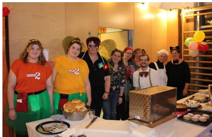
Das motivierte Catering-Team