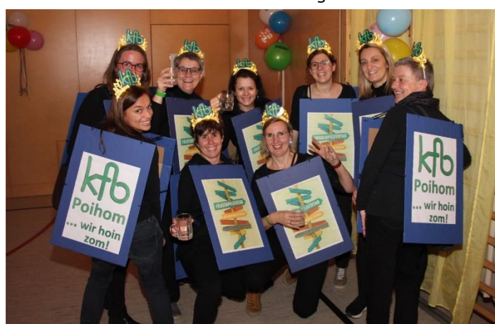
Freundschaftsbesuch von der KFB des Nachbarorts