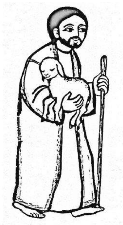
(Layout: Alois & Ulli Giggleitner)