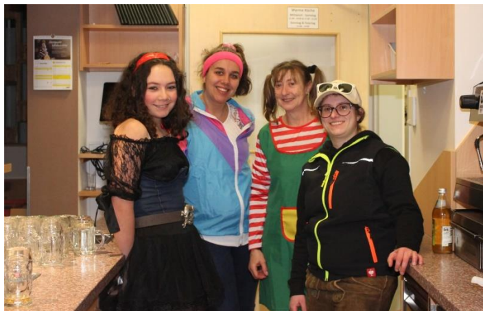
Das engagierte Schank-Team

DANKE den KFB-Frauen und ihren HelferInnen für die viele Vorbereitung, die Dekoration, das Aufbauen in der Mehrzweckhalle, die vielen Dienste beim Gschnas selbst - und am Sonntagvormittag für das Aufräumen und die gründliche Reinigung!