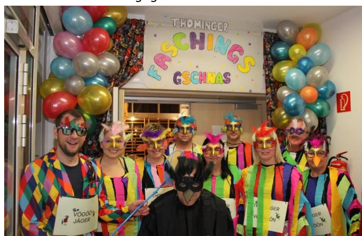
Viele kreative Masken ergaben ein buntes Fest