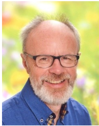
Geschätzte Waldhauserinnen und Waldhauser!

Ich mache mir Sorgen um die Welt. Genauer gesagt, mache ich mir Sorgen um die Zukunft der Menschheit. Ich sehe die Freiheit, die Menschenwürde und auch unseren Lebensraum gefährdet. Viel zu viele Autokraten, autoritäre Politiker und große Konzerne haben den Hebel in der Hand. Bei ihnen zählt: Geld, Macht und Einfluss. Der konkrete Mensch wird gar nicht gesehen, im Gegenteil: er kommt von Tag zu Tag mehr unter die Räder. Die Errungenschaften der französischen Revolution „Freiheit, Gleichheit und Brüderlichkeit“ werden über Bord geworfen. Bleiben nur mehr Scherben zurück?