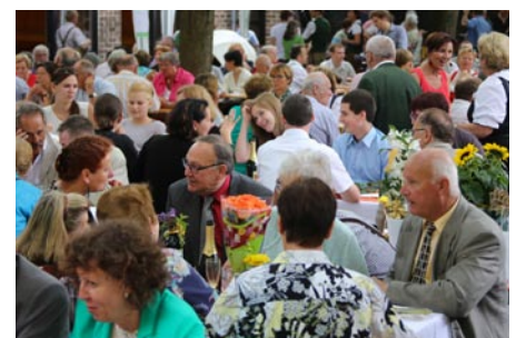
Gäste beim Frühschoppen der Pfarre.

Im Anschluss wurde zum Frühschoppen geladen, der auch heuer wieder vom FA Feste & Feiern organisiert wurde. Für beste Unterhaltung, Musik, Speis und Trank war gesorgt. Die Stimmung war trotz Wetterumschwungs gut und die Jubelpaare konnten ihren Festtag würdig ausklingen lassen.