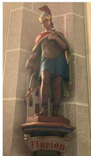
Hl. Florian in unserer Pfarrkirche

Besondere Bedeutung hat der hl. Florian für die Feuerwehr, da er der Schutzpatron gegen Feuer und der Feuerwehr ist. Seit 2004 ist er auch der Landespatron von Oberösterreich.