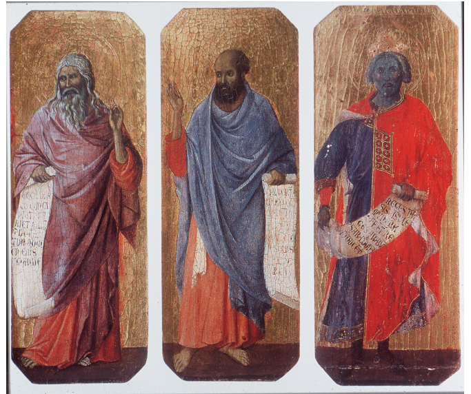
Duccio di Buoninsegna (Giotto), ca. 1308 - 1311, Dommuseum, Siena. Propheten.