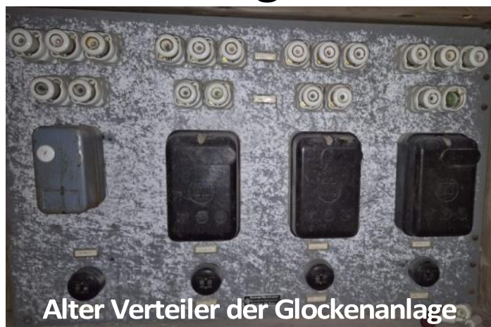
Alter Verteiler der Glockenanlage