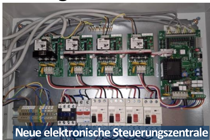
Neue elektronische Steuerungszentrale

Laufend auftretende Probleme mit der Glockenanlage gaben den Anlass dazu von mehreren Fachfirmen Angebote über eine Erneuerung der Steuerung und der Antriebe für alle 4 Glocken einzuholen. Die Firma Köstner aus Engelhartzell ist daraus als Bestbieter hervorgegangen und erhielt den Auftrag für dieses Vorhaben. Die Ausführung der Arbeiten erfolgte am 6. und 7. Oktober. Die Ansteuerung der Antriebsmotore geschieht nun elektronisch und kann wesentlich besser an die Schwingeneigenschaften der Glocken angepasst werden. Dies wirkt sich wiederum schonend auf die gesamten mechanischen Antriebe, Ketten und Kettenräder aus.