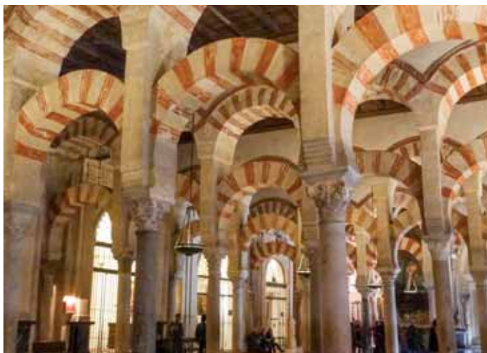
Cordoba: Der berühmte Säulenwald in der Mezquita - nach der Alhambra das bedeutendste maurische Bauwerk