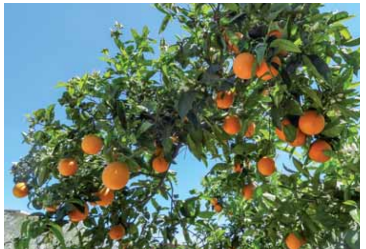
Führung in einer Orangenfinca