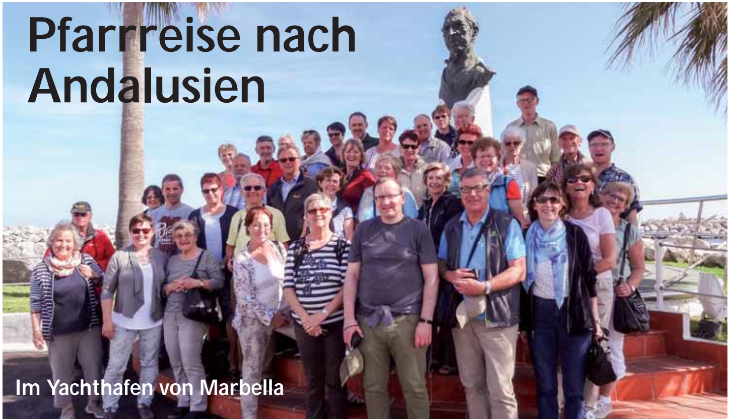
Im Yachthafen von Marbella