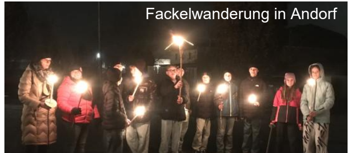
Fackelwanderung in Andorf

Wir möchten uns sehr herzlich bei euch Firmlingen für die tolle Mitarbeit und euer Interesse bedanken. Mögen euch Gott und eure Mitmenschen auf Kurs halten, wenn ihr einmal die Orientierung verliert und euch sicher in den Hafen bringen.