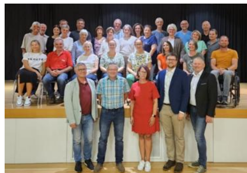
Pfarrlicher Pastoralrat der Pfarre Pramtal