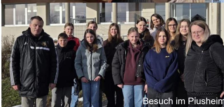
Besuch im Piusheim