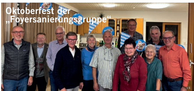
Oktoberfest der „Foyersanierungsgruppe“