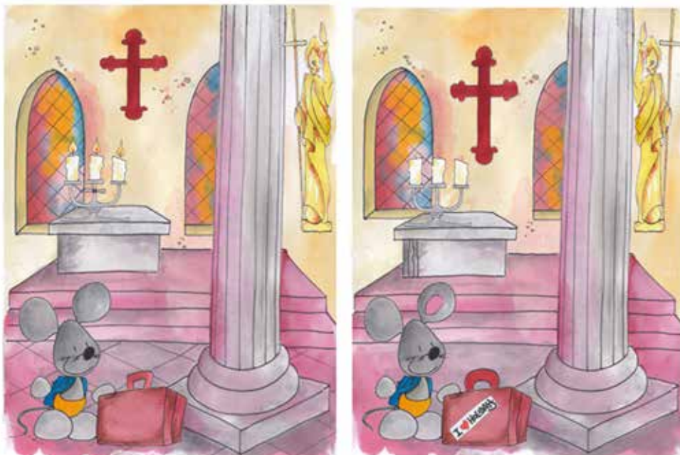
Bild „Kirchenmaus“: Daria Broda, www.knollmaennchen.de Bild „Kinderfragen“: Anna Zeis-Ziegler, In: Pfarrbriefservice.de

DIE KIRCHENMAUS MACHT URLAUB: Mit ihrem gepackten Koffer steht sie in der Kirche und wartet auf den Bus. Doch die beiden Bilder von ihr sind nicht gleich. In das rechte Bild haben sich elf Unterschiede hineingemogelt. Findest du sie?