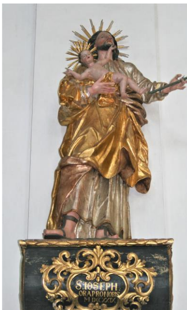
Josefi - Statue in der StK

Bitte tragen auch Sie dazu bei, dass wir die Situation gemeinsam wieder in den Griff bekommen.