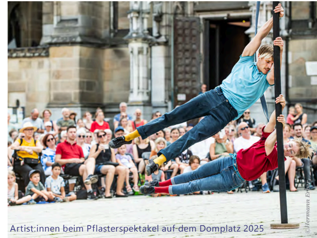
Artist:innen beim Pflasterspektakel auf dem Domplatz 2025

Vom 23. bis 25. Juli 2026 steht Linz wieder ganz im Zeichen der Straßenkunst. Über 100 Compagnien und Solo-Künstler:innen begeistern – unter anderem am Domplatz – mit herausragendem Können und unterhalten mit viel Humor und Improvisationskunst. Das jeweilige Tagesprogramm ist jeden Festivaltag um die Mittagszeit online und ab Festivalbeginn in gedruckter Form an den Infopoints erhältlich. Auch ein Team der Festivalseelsorge der Diözese Linz ist beim Pflasterspektakel unterwegs.