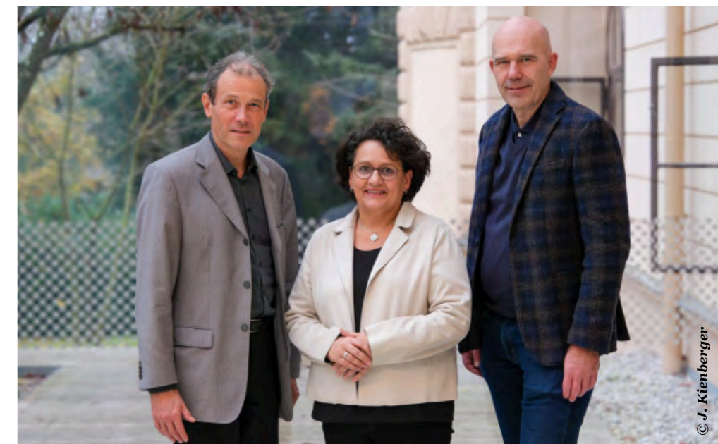
Der Pfarrvorstand fördert das Zusammenwachsen der einzelnen Gemeinden und koordiniert die Dienste.