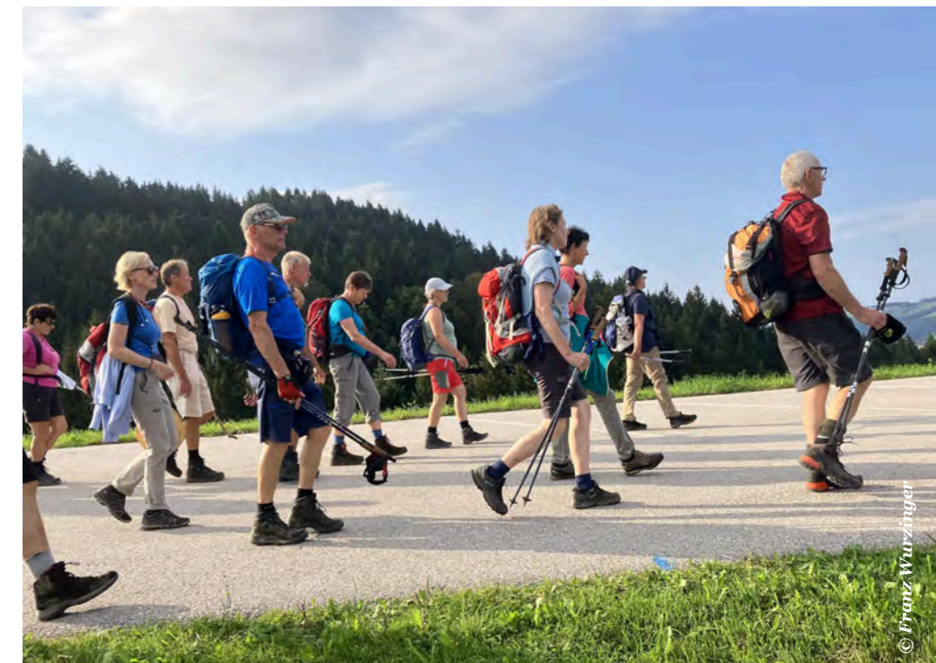
Die Gemeinschaft, die wunderbaren Landschaften und das spirituelle Erlebnis sind Entschädigung für die körperlichen Herausforderungen, die täglich bewältigt werden.

Die tägliche Wanderstrecke beträgt rund 30 km. Die Übernachtungen und Abendessen sind in Gasthöfen geplant. Der Gepäcktransport erfolgt durch ein Begleitfahrzeug, die Rückreise per Bus. Information und Anmeldung: domlinz@aon.at, 0664 4536853 oder im Pfarrbüro bis Mitte Mai 2026.