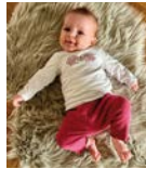
Katharina Zaglmaier Peterfeld 9 getauft am 01.06.