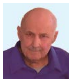
Josef Spitzeder Ofen 3, am 18.05.