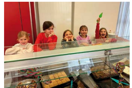
Kuchenverkauf beim Pfarrcafe