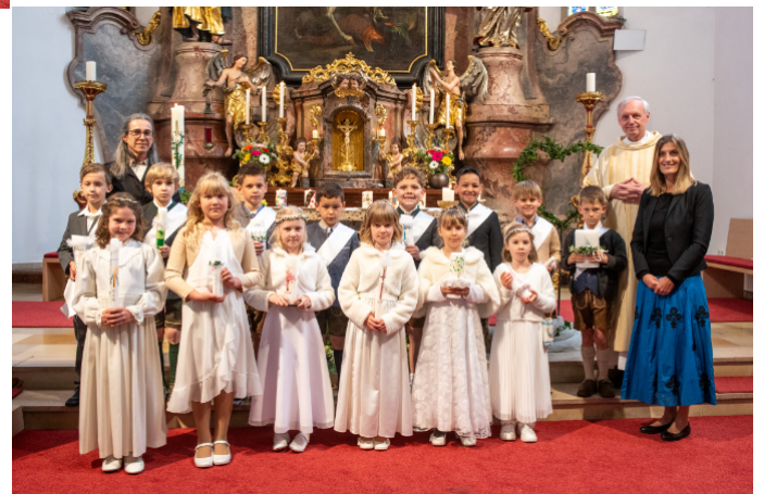
2. Klasse der Volksschule Straß i.A.