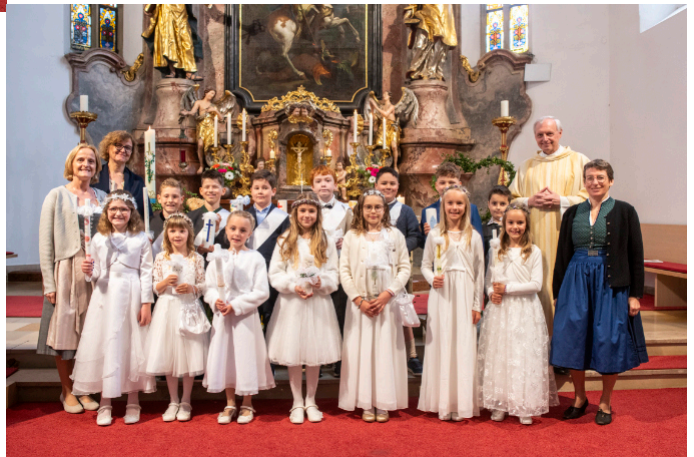
2c Klasse der Volksschule St. Georgen i.A.