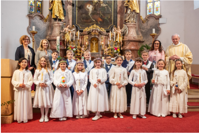
2a Klasse der Volksschule St. Georgen i.A.