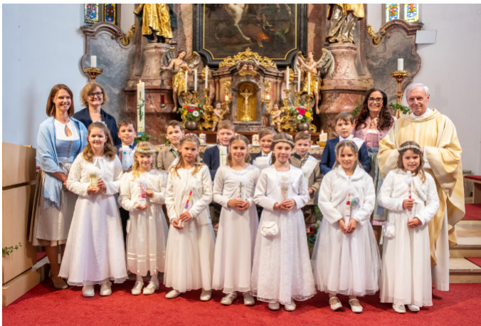
2b Klasse der Volksschule St. Georgen i.A.