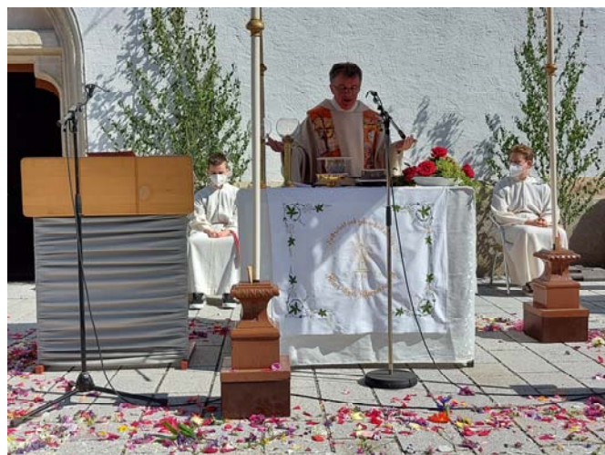
Eine Prozession war aufgrund der Corona-Pandemie leider nicht möglich. Bei strahlendem Sonnenschein konnte der Fronleichnamsgottesdienst am 3. Juni 2021 aber vor der Stadtpfarrkirche gefeiert werden.