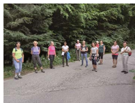
Einige der Teilnehmerinnen an der Vollmondwanderung

In der lauen Sommernacht des 24. Juni 2021 führte der Fachausschuss Bibel & Spiritualität eine Wanderung bei Vollmond, der sich allerdings hinter einer Wolkendecke verbarg, durch. Zur Sommersonnenwende wurde durch die Betrachtung der Natur, das Hören von ausgewählten biblischen, philosophischen und meditativen Texten den Teilnehmerinnen und Teilnehmern bewusst, dass es im Leben immer wieder Wenden gibt, Wenden, die schmerzen, Wenden, die guttun, Wenden, die helfen, sich weiterzuentwickeln. Es ist tröstend zu wissen, dass Gott durch diese Wenden mit uns geht. ER wendet vieles zum Guten. ■