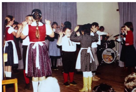
Oben Vogerltanz der Jungchar, rechts ein Sketch der KMB