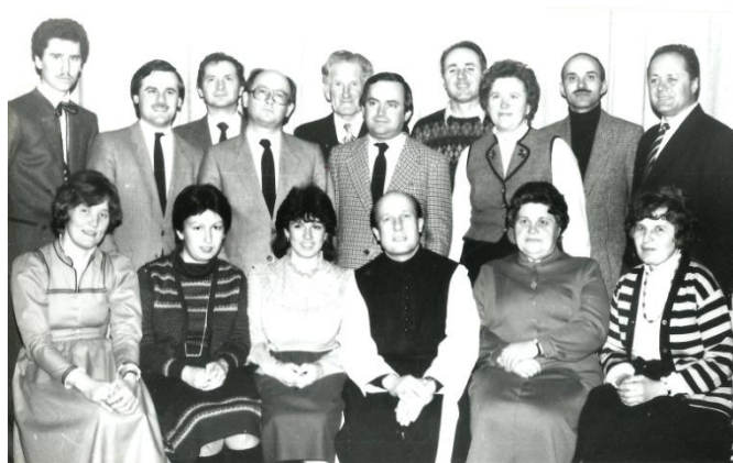
Der Pfarrgemeinderat 1984: (v.l.)