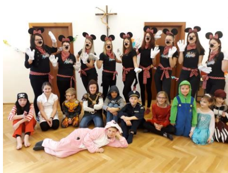
JUNGSCHEAR - FASCHING 2019

Die Preisverleihung findet am 01. September 2019 in der Pfarrkirche Asten bei Linz statt. Wir laden dazu alle Interessierten herzlich ein!