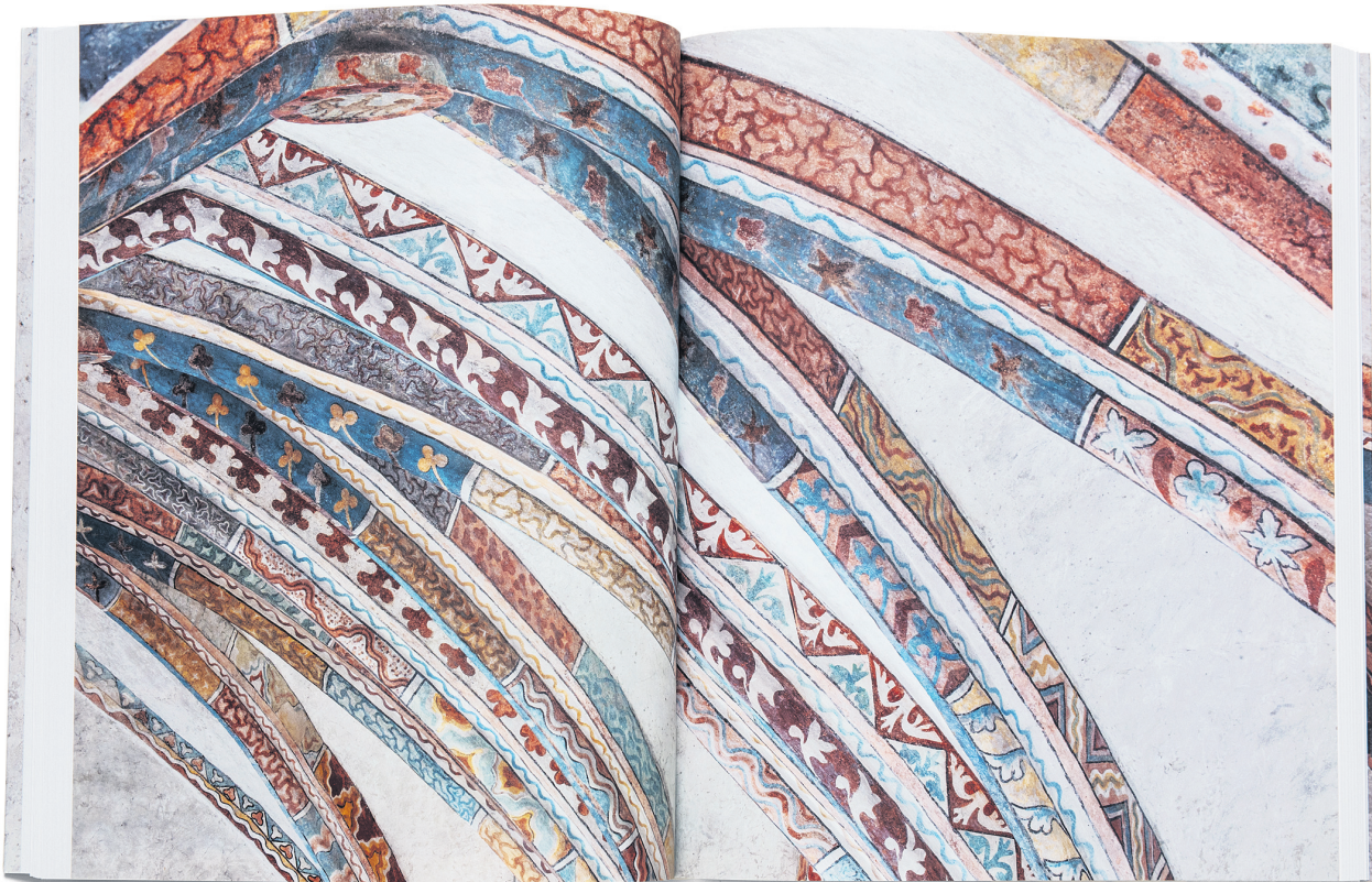
Bibliophil erfährt die frisch renovierte Kremser Dominikanerkirche eine Art Auferstehung künstlerischer Natur.