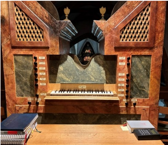
Die Orgel hat 50 Tasten.

Nach kurzem Brainstorming und Rundgang in der Kirche haben sie sich dafür entschieden, unsere wunderschöne Orgel näher vorzustellen: