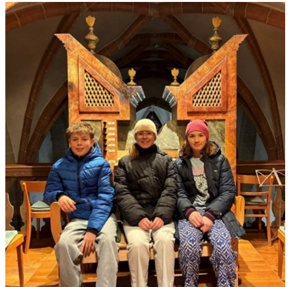
Unsere Recherche Profis

Wir haben uns freiwillig für dieses Projekt gemeldet und es hat uns sehr viel Spaß gemacht.