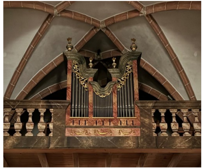
Sie wurde vom Orgelbauer Verschueren hergestellt und 1999 eingebaut.