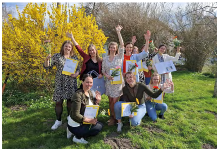
Basislehrgang 74 in Ottang

Der Basislehrgang besteht aus einem Einführungsmodul, fünf weiteren Modulen, Arbeitsaufträgen in Praxisgruppentreffen zwischen den Modulen, Hospitationen und der Absolvierung eines Kindernotfallkurses.