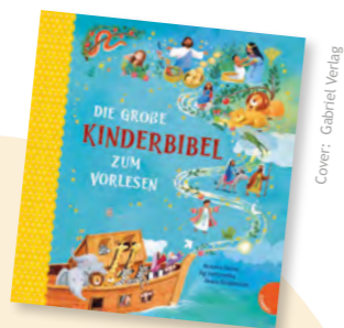
Cover: Gabriel Verlag