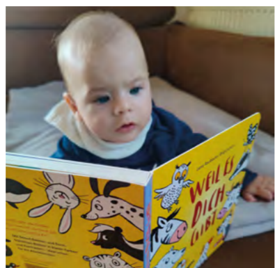
Treffpunkt St. Georgen.i.A.