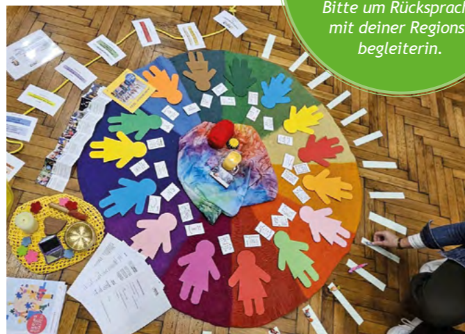
Basislehrgang 76 in Wels

Bitte um Rücksprache mit deiner Regionsbegleiterin.