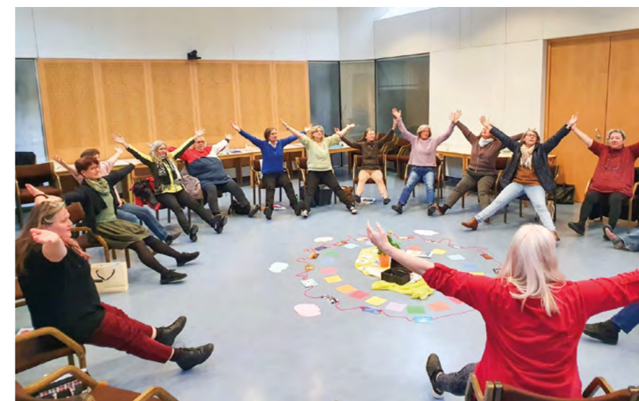
Trainerinnen selbst aktiv

Mit den anspruchsvollen und abwechslungsreichen Übungen halten sich auch die SelBA-Trainer:innen selbst fit, während sie andere Menschen bereichern. Doch damit nicht genug, denn oben-dreien gibt es die SelBA-Gemeinschaft, die am besten bei der Fachtagung in einem Raum mit 200 „g‘standenen Persönlichkeiten“ spürbar wird.