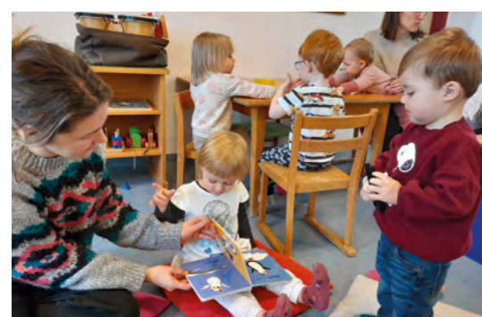
Treffpunkt Bad Wimsbach Neydharting