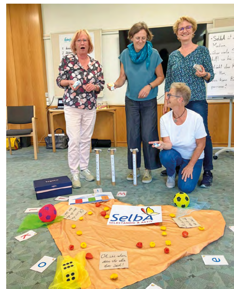
Freude im Tun bei den angehenden SelBA-Trainerinnen

Nähere Informationen & Anmeldung: selba-ausbildung@dioezese-linz.at