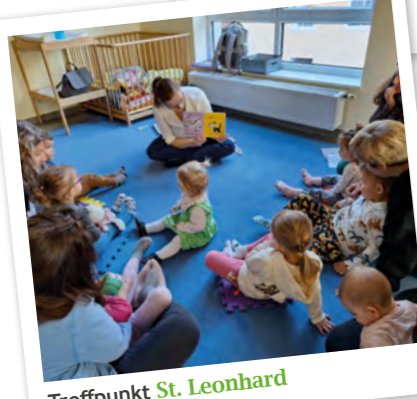
Treffpunkt St. Leonhard