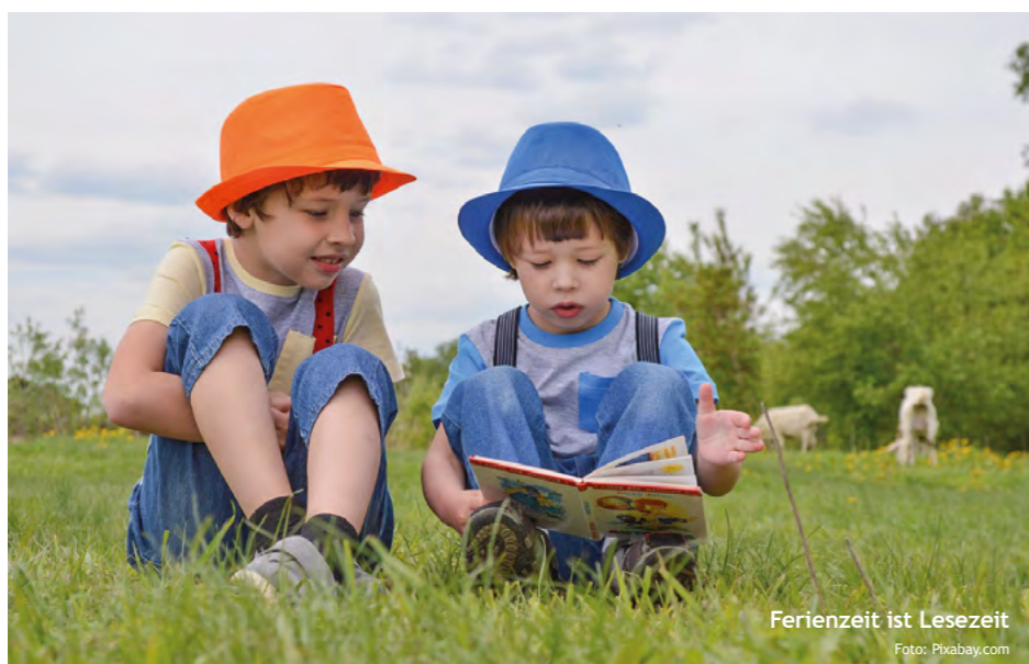
Ferienzeit ist Lesezeit

Die Initiative zeigt eindrucksvoll, wie niedrigschwellige Angebote Kindern Zugang zu Sprache, Fantasie und Kreativität eröffnen können. Wer spielerisch liest, liest fürs Leben – und der Sommer ist der perfekte Zeitpunkt dafür!