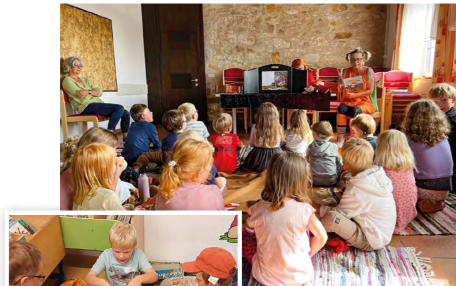
Ferienprogramm in der Bibliothek Kleinzell

Herzstück der Initiative ist der Lesepass, der ab Juni in den öffentlichen Bibliotheken an die Kinder ausgegeben wird. Für jedes im Juli, August oder September in einer öffentlichen Bibliothek ausgeliehene Buch gibt es einen Stempel in den Pass. Viele Bibliotheken beziehen auch Kleinkinder aktiv ein, indem vorgelesene Bücher ebenfalls zählen. Die ausgefüllten Pässe nehmen an einer großen Schlussverlosung teil: 100 Kinder bekommen einen Buchpreis per Post, weitere 50 Kinder erhalten ihren Preis bei einer feierlichen Veranstaltung im Herbst persönlich überreicht.