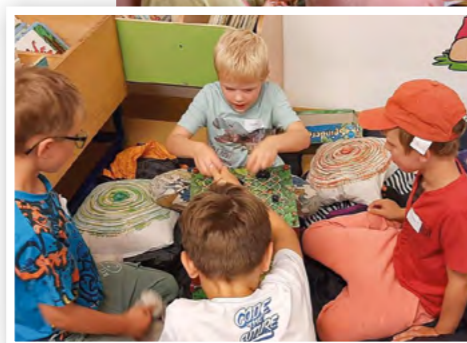
Lesenacht in der Bibliothek Hagenberg