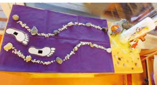
An jedem Tag der Fastenzeit wird ein Fußabdruck bis hin zur Jesuskerze aufgelegt