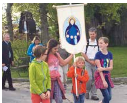
Familienwallfahrt nach Adlwang

Herzliche Einladung zur Kinderkirche im Pfarrheim. Wir feiern dort gemeinsam mit Kiki, Kigo und der Raupe Pasquarella die Auferstehung von Jesus Christus. Beginn ist um 9:45 Uhr . Wir erleben Osterfreude, singen und beten zusammen und gehen dann gemeinsam zum Vater Unser hinüber in die Kirche. Dort feiern wir mit der ganzen Gottesdienstgemeinschaft die Eucharistie. Kiki und Kigo freuen sich auf dich!