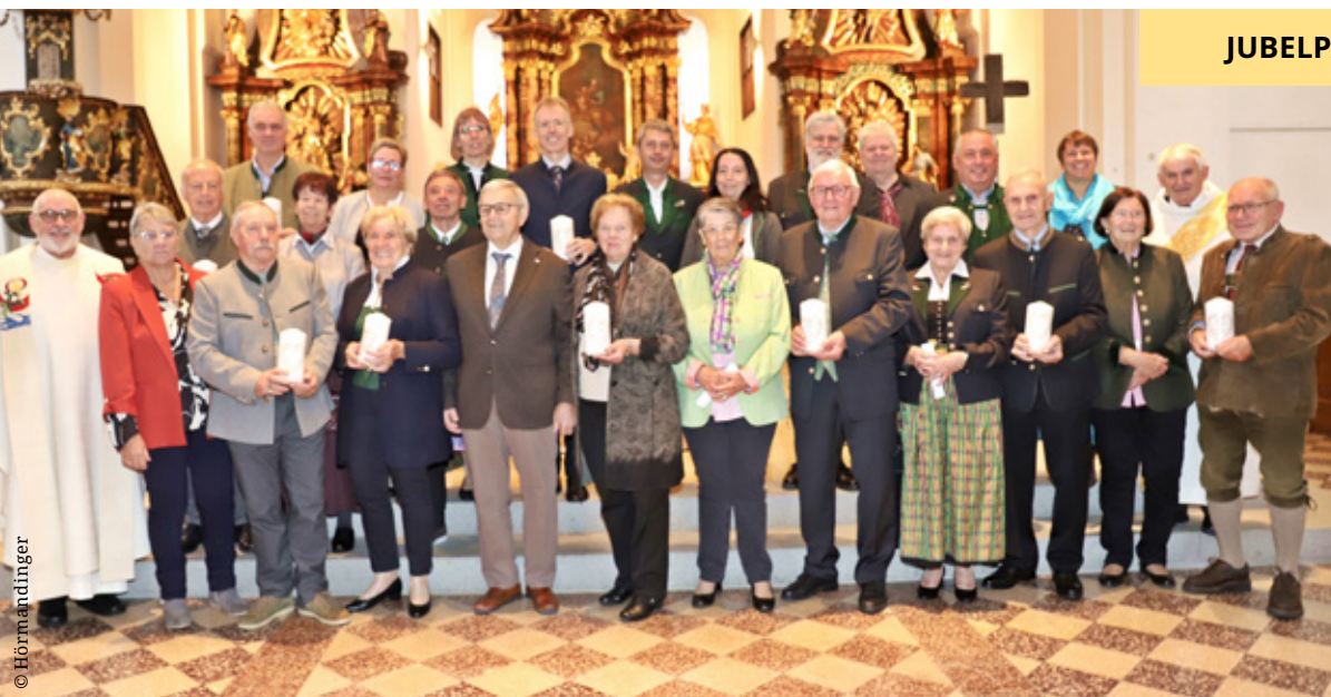
JUBELPAARE • SO 12. OKT. 2025