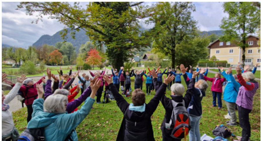
FRAUENPILGERTAG SA 11. OKT. 2025