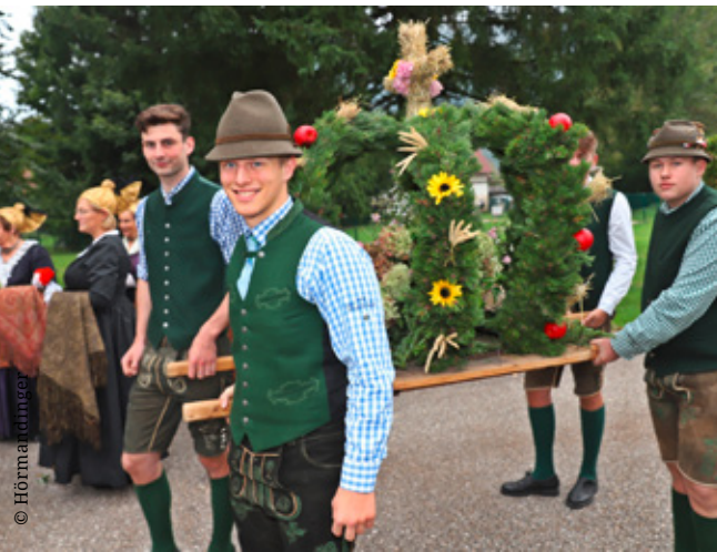
ERNTEDANKFEST 28.09.2025 ROITH 05.10.2025 EBENSEE