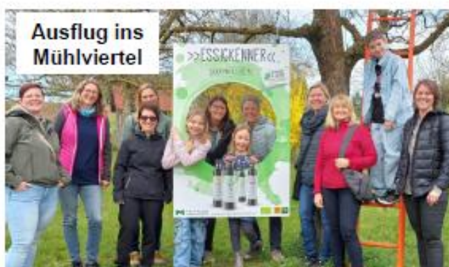
Ausflug ins Mühlviertel

Ein besonderer Höhepunkt war der Besuch des Bauernhofes Pankrazhofer in Tragwein, am 11. April 2026. Neun Mitglieder der Mütterrunde und drei begeisterte Kinder besichtigten Obstbaumflächen und Pressanlage und verkosteten Säfte, Frizzante, Most, Essige und Senf im wunderschönen Hofladen. Anschließend ging es weiter in die Pralinenwelt Wenschitz/Allhaming, wo es viele interessante Einblicke und natürlich auch Köstlichkeiten zum Verkosten gab.