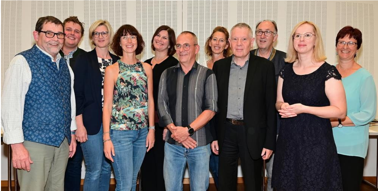
Kernteam Strukturprozess – Pfarre Neu – Dekanat Schörfling