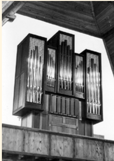
Orgel Micheldorf 1973

Jetzt einmal ganz ehrlich: Auch, wenn man nicht immer ganz genauinhört, was „da oben“ gespielt wird, ist die Orgel in unserer Kirche aus unserem liturgischen Kirchenjahr eigentlich nicht wegzudenken. Ob Jubel oder Trauer, Meditation oder Dank – die Orgel ist ein Vehikel für die Gefühle der Gläubigen. Sie multipliziert das gesungene Gebet und bringt es hin vor Gott.