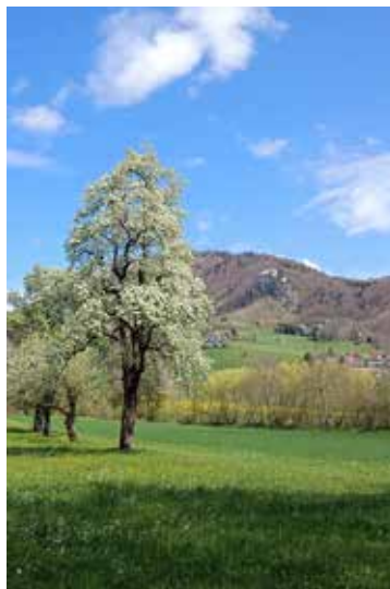
Blick zur Burg Altpernstein/ Michaela Buchegger