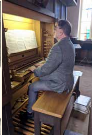
Unsere Orgel heute