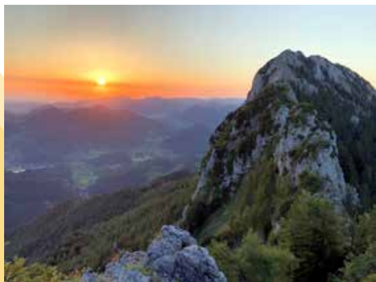
Törlspitz am Morgen / Jürgen Hofer