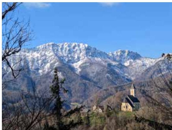
Blick zum Georgenberg / Elfi Putzer