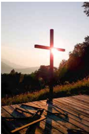
Altpernstein am Abend / Jürgen Hofer