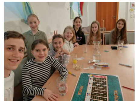
Foto: Ministrantenstunde im Stift

Für alle, die Ministranten werden wollen, bieten wir im Juni Proben-Termine an. Wer nicht bei allen Proben teilnehmen kann, kann trotzdem zum Ministrieren beginnen. Die Erstkommunion-Kinder haben in der Schule eine Einladung zum Ministrantendienst erhalten. Auch ältere Schülerinnen und Schüler sind zum Ministrantendienst eingeladen.