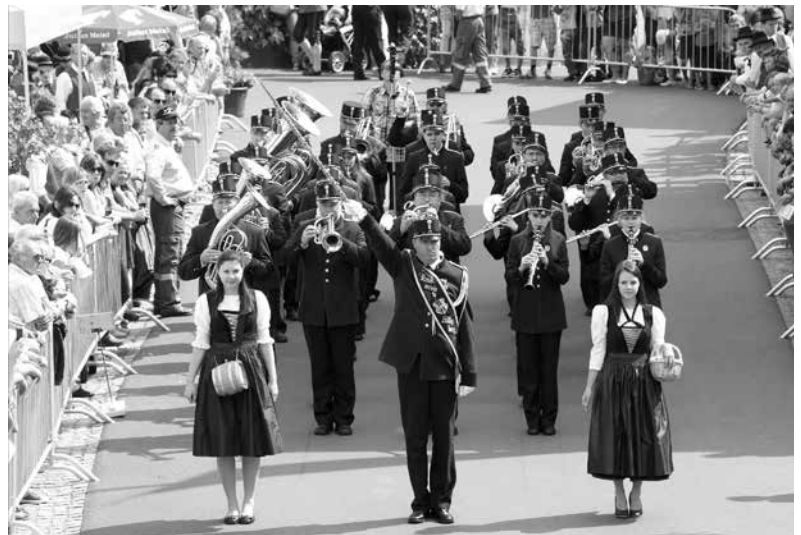
Bezirksmusikfest in Vorderweißenbach, Foto von Andrea Dumphart und MV Vorderweißenbach – Der Zauber der Montur! Wir waren mit Abstand die Schönsten (und auch die Einzigen) in Uniform.

Ebenfalls auf den Weg machten sich heuer unsere JungmusikerInnen, und zwar zur Fortbildungswoche nach Bad Ischl. In der JUMU-Woche wurde viel musiziert, marschiert und hinter die Kulissen der Vereinsarbeit geschnuppert. Im Vordergrund standen natürlich Spaß und Freude in einer Gemeinschaft von Gleichgesinnten.