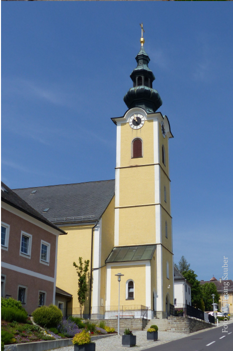
Pfarrgemeinde Traberg Kirche St. Josef

Nach dem Jahreswechsel 2026/27 sollten die Personen feststehen. Ebenfalls ab Herbst werden sich die Pfarrgemeinderäte mit der Findung von geeigneten Frauen und Männern für die Seelsorgeteams beschäftigen, und im Winter wird auch die zweite größere Veranstaltung des Umstellungsprozesses stattfinden – die Visionsklausur. Hier werden Ziele und mögliche Schwerpunkte der neuen gemeinsamen Pfarre erarbeitet werden.