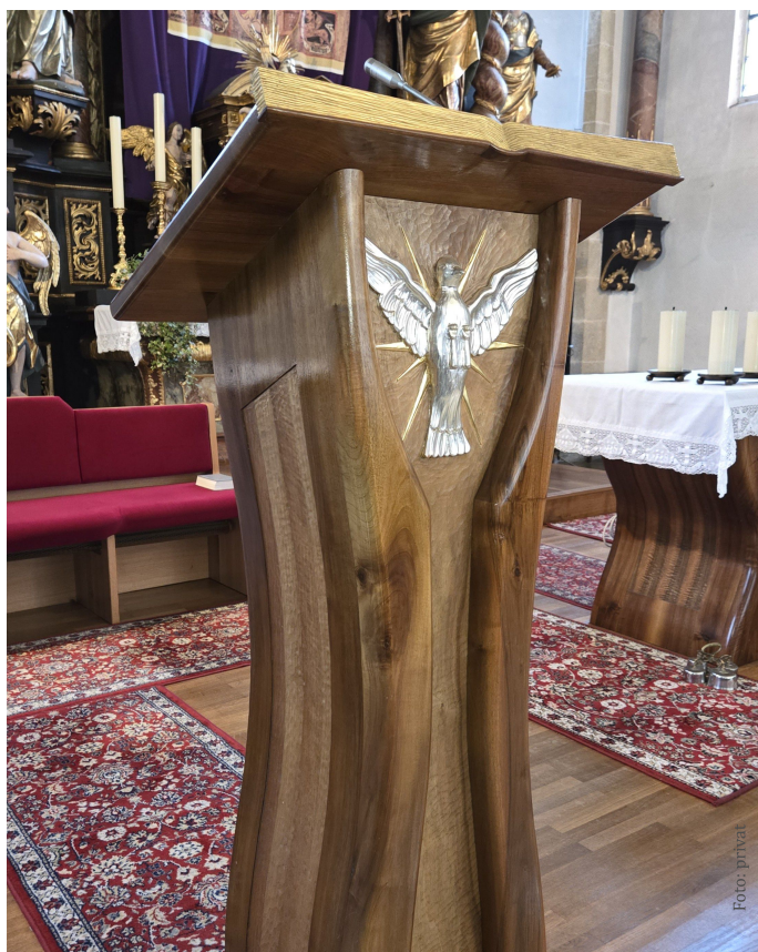
Der Ambo („Tisch des Wortes“) ist der Ort des Wortgottesdienstes.

D ieser Text eines Kanons beschreibt auf treffende Weise den tieferen Sinn des Wortgottesdienstes, der sich als zweiter Teil der Messfeier an die Eröffnung anschließt. Er ist örtlich am Ambo als dem „Tisch des Wortes“ verankert und dient dazu, die Heilige Schrift kennenzulernen, lädt ein, unser Leben danach zu gestalten und vergegenwärtigt den Inhalt der vorgelegten Erzählungen. Grob gesagt besteht der Wortgottesdienst aus zwei Abschnitten. Der erste davon ist der Akt der Verkündigung .