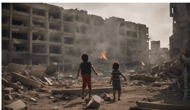
Die Unvollkommenheit unserer Welt bringen wir in den Fürbitten vor Gott.

Gottes endzeitliches Heil oder mit anderen Worten das Reich Gottes wird uns also im Wortgottesdienst (und in der ganzen Heiligen Messe) vor Augen geführt. Man muss jedoch nur die Zeitungen aufschlagen, um zu sehen, dass es im Hier und Jetzt bei Weitem noch nicht zur vollen Ausprägung gelangt ist. Aus diesem Grund folgt nach dem Evangelium und gegebenenfalls der Predigt das Allgemeine Gebet .