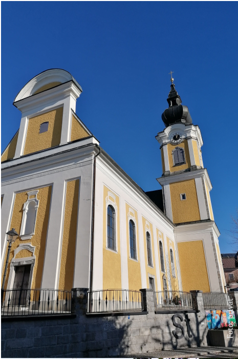
Pfarrgemeinde St. Johann am Wimberg Kirche St. Johannes der Täufer