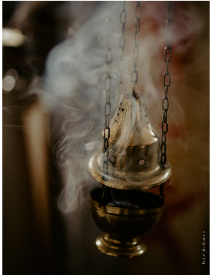
Zur Ehrerbietung wird das Buch mit dem Evangelium beweihräuchert.

Beendigung des Vortrags durch einen Kuss geehrt. In manchen Kirchen wird das Buch anschließend an einer eigenen Stelle im Kirchenraum aufgestellt.