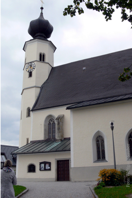
Pfarrgemeinde St. Veit im Mühlkreis Kirche St. Vitus