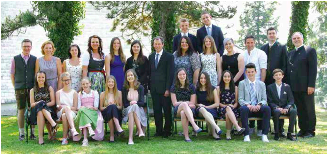
Firmlinge und PatInnen Lichtenberg

[Infos zur Firmvorbereitung auf unserer Homepage: www.dioezese-linz.at/pfarre/4501/glaubenfeiern/was-tunwenn/ichgefirtwerdenmoechte ]