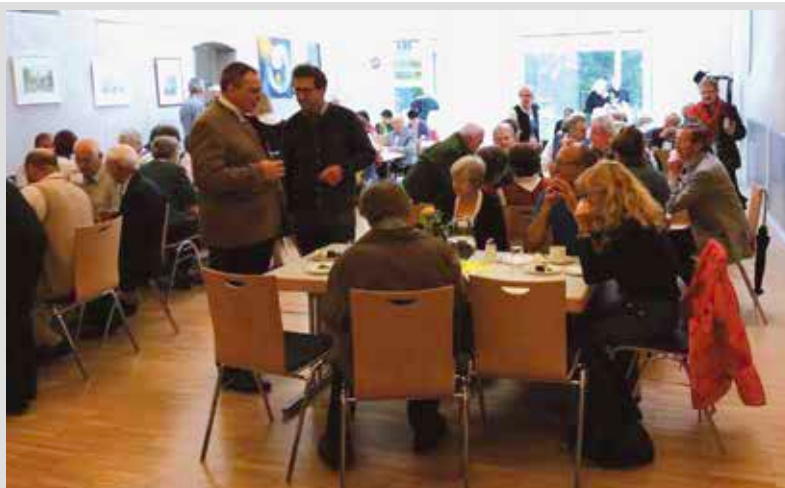
Stelzhamerbund-Maiandacht mit anschließender Bewirtung im Pfarrsaal