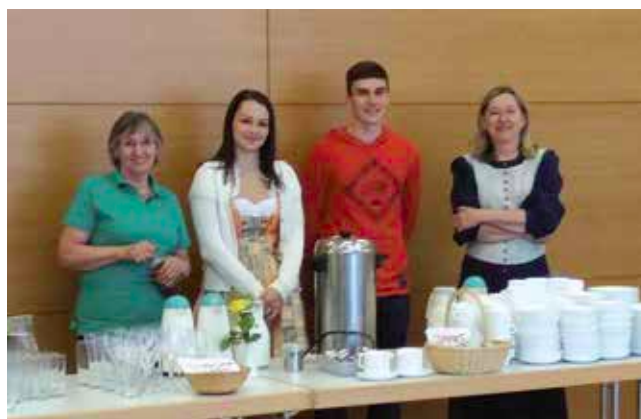
Bewirtungsteam Stelzhamerbund Maiandacht