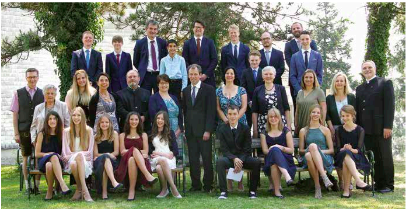
Firmlinge und PatInnen Pöstlingberg