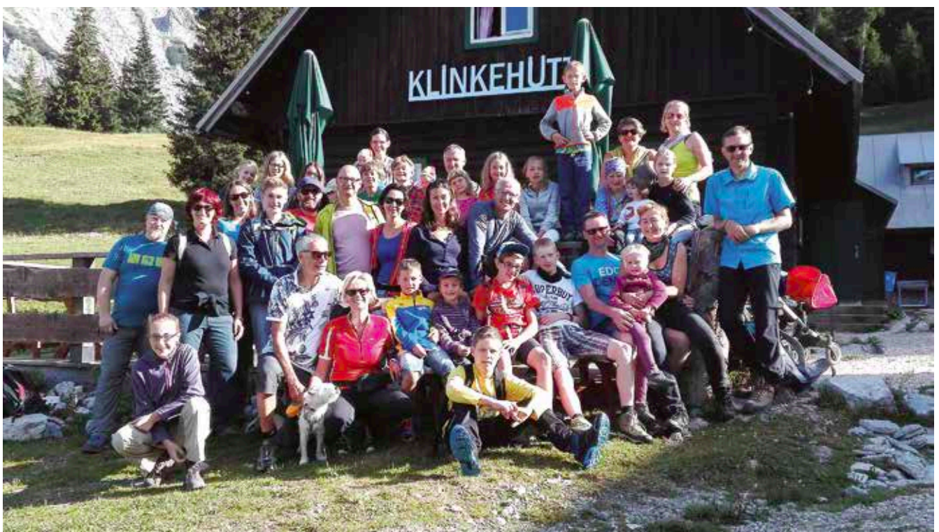
Das war das Bergwochenende 2016 auf der Oberst-Klinke-Hütte...

Weitere Infos dazu finden Sie auf unserer Homepage: www.dioezese-linz.at/pfarren/lichtenberg