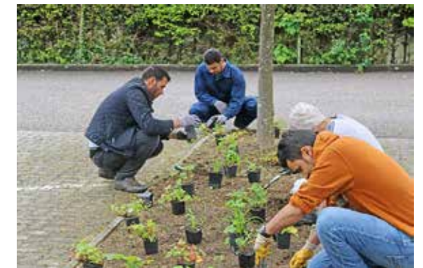
Bepflanzung des Grünstreifens neben der Gemeinde