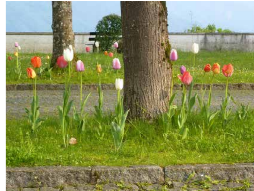
Tulpenblüte im Kirchenpark

Vielleicht war die Tulpenblüte im Kirchenpark in diesem Frühjahr für viele eine Überraschung. Am bunten Erscheinungsbild hatten zwei Asylwerber einen großen Anteil. Gemeinsam legten wir im Herbst 2015 mehrere hundert Tulpenzwiebel rund um die Linden und Krokusse im Rasen ein. Ein Bauhofmitarbeiter hatte zu unserem Vorhaben gemeint: „Wir freuen uns über jedes 'Bleamal' in Attersee, auch wenn wir rundherum mähen müssen.“ Das war wirklich motivierend und ausschlaggebend dafür, unseren Kirchenpark mit seinem wunderschönen Baumbestand für unsere erste Gestaltung auszuwählen. Die helfenden Männer stellten danach klar, dass sie gerne mehr für Attersee tun möchten. Deshalb bepflanzten wir im Mai dieses Jahres auch einen Grünstreifen unter Bäumen am Parkplatz des Strandbades Attersee, neben dem Gemeindegebäude. Wir waren wieder ein kleines Team mit sechs Personen aus Syrien, Libyen, dem Irak und Österreich. In kürzester Zeit waren 20 Quadratmeter mit mehrjährigen Blumen gepflanzt. Wir haben dabei viel und herzlich gelacht.