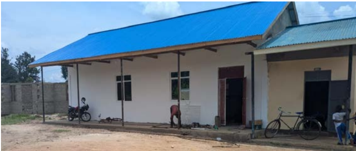
Baufortschritt Computerraum bei unserer Schule in Tansania, der vom Handarbeiten-Verkauf finanziert wird