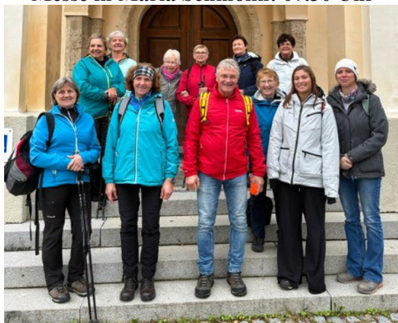
Fußwallfahrt 2025

Abgang: 01.30 Uhr in der Haberroith Messe in Maria Schmolln: 07.30 Uhr