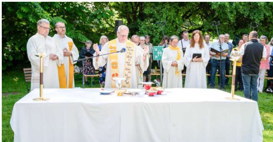
Der Festgottesdienst war gut besucht