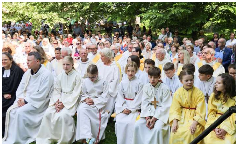
Schloss Puchberg lieferte einen schönen Rahmen für die Veranstaltung