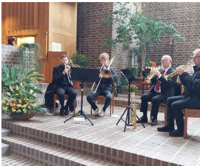
Der Festgottesdienst am Ostersonntag wurde durch ein Bläserquartett feierlich gestaltet