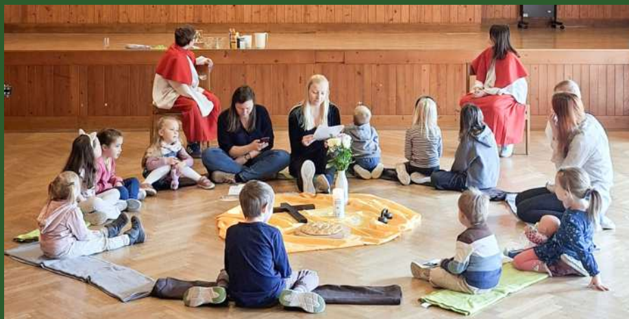
Das Thema Auferstehung in kindgerechter Form

Am 19. April feierten viele Kinder wieder gemeinsam das Fest der Kinderkirche. Sie setzen sich mit der Auferstehung auseinander und erinnerten sich an Jesus beim Brotbrechen. Mit dem Buch „Der Baum der Erinnerungen“ und selbstgemachten Blumensamenkugeln gelang ein runder Abschluss.