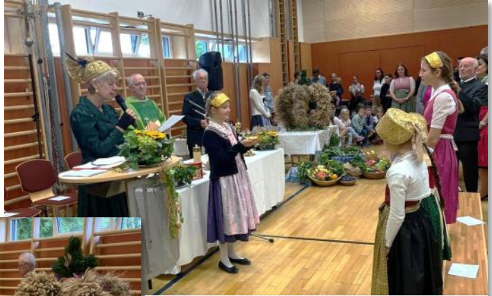
Erntedank der Goldhaubengruppe