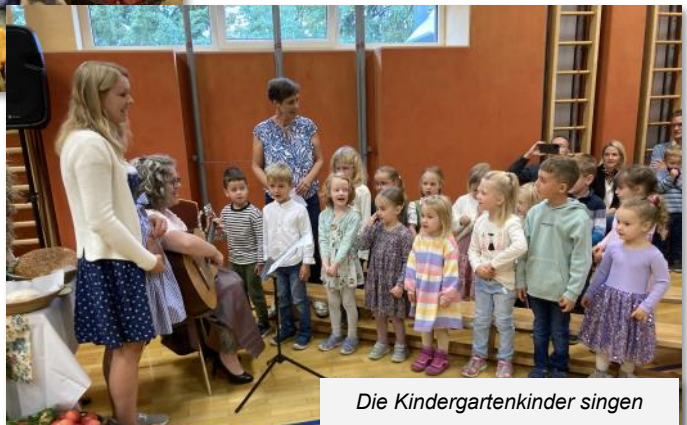
Die Kindergartenkinder singen