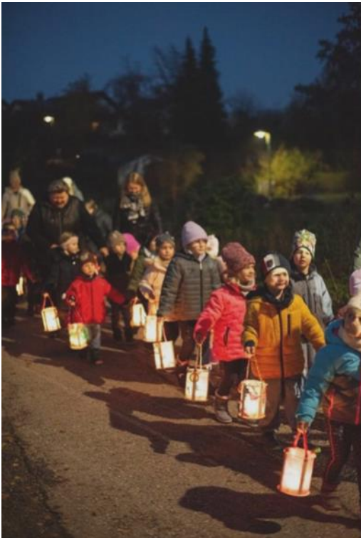
Die Kindergartenkinder auf dem Weg zur Kirche

Besonders groß war die Freude über die leckeren Kipferl, die die Kinder im Anschluss teilen durften.