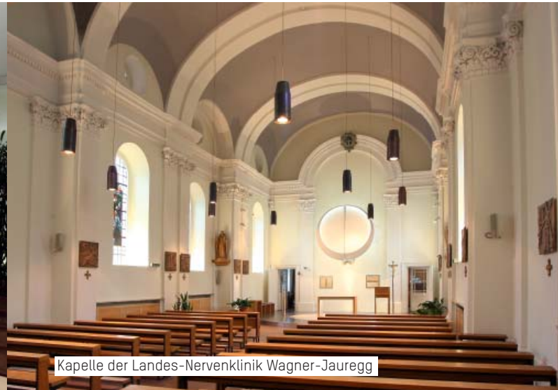
Kapelle der Landes-Nervenlinik Wagner-Jauregg