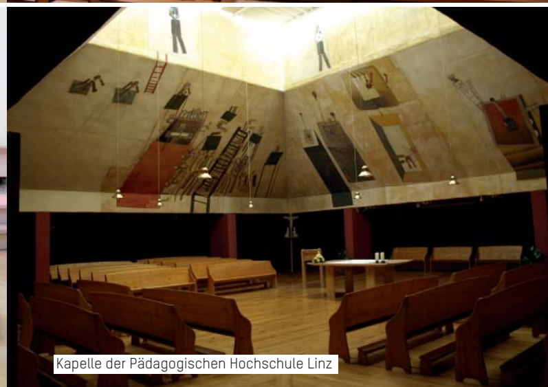
Kapelle der Pädagogischen Hochschule Linz