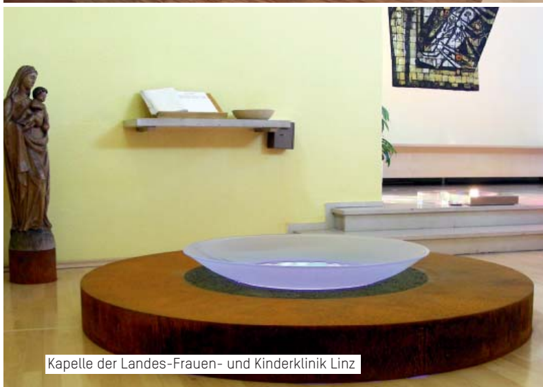
Kapelle der Landes-Frauen- und Kinderklinik Linz