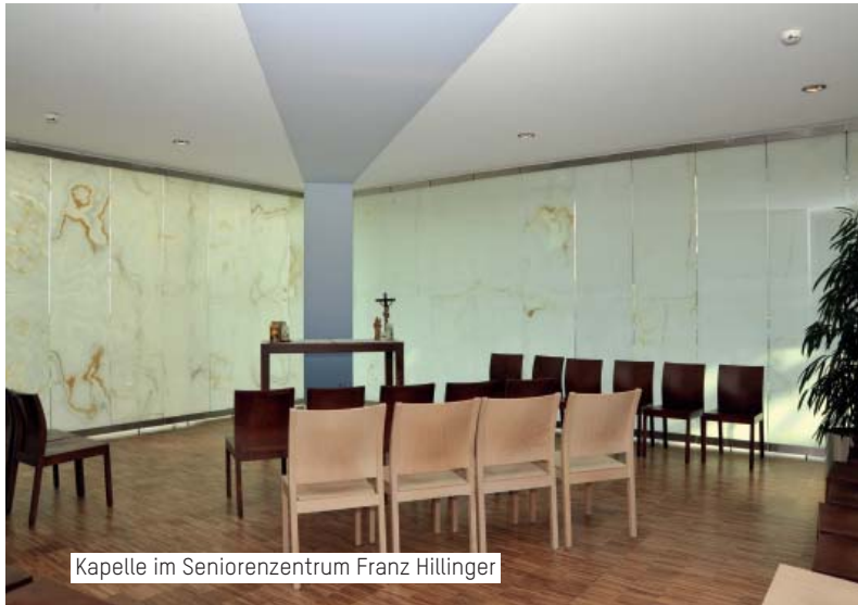
Kapelle im Seniorenzentrum Franz Hillinger