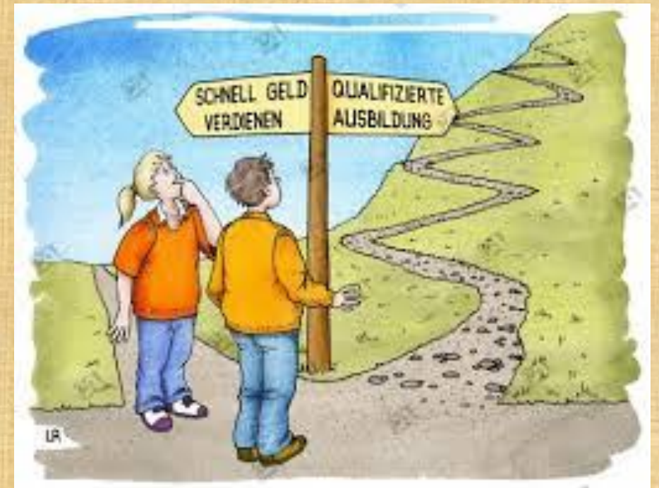
Zwei Wege führen ins Berufsleben