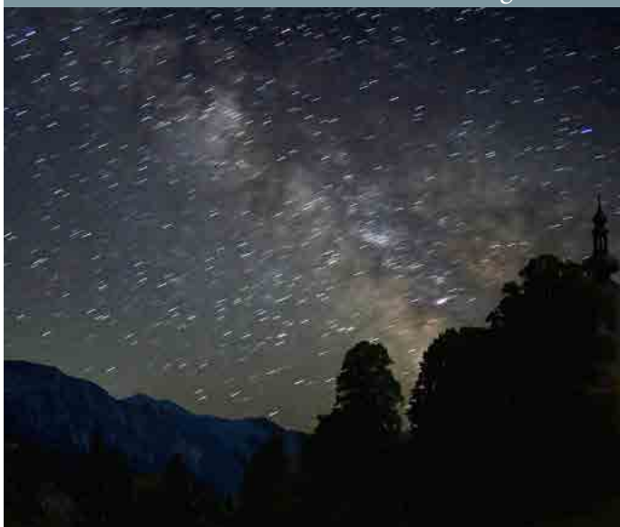
Sternenhimmel über Attersee; C. Ballestrem

Öffnungszeiten Pfarrbüro Attersee DO und FR jeweils von 9:00 bis 11:00 Uhr Tel: 07666 / 7856 www.dioezese-linz.at/attersee E-Mail: pfarre.attersee@dioezese-linz.at