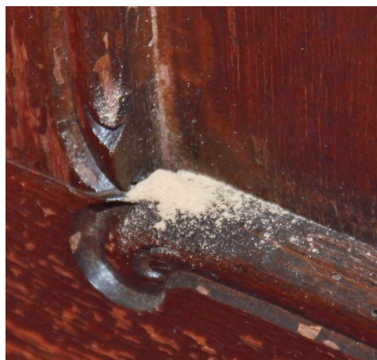
▲ Holzmehl rieselt aus den Fraßgängen und zeigt aktiven Befall an

Regelmäßiges Monitoring ist die beste Früherkennung! Achten Sie auf Bohrmehlhäufchen oder helle frische Bohrlöcher. Kontrollieren Sie dabei auch „vergessene“ Orte wie z.B. Rückseiten, selten geöffnete Fächer oder Schränke, nicht verwendete Leuchter etc.