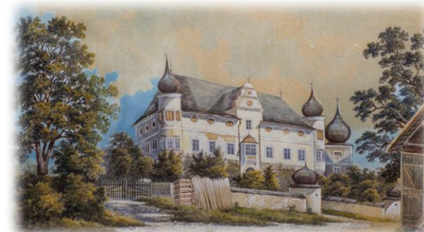
Pfarrhof Buchkirchen um 1895