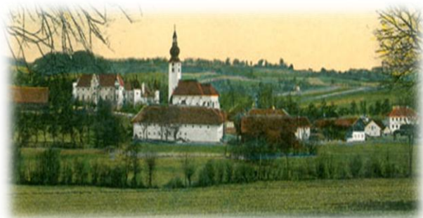
Buchkirchen um 1912