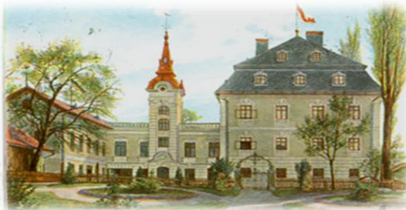
Haushaltungsschule Mistelbach um 1902

Ostermontag 22. April 2019, 6:00 Uhr (bitte um Anmeldung bei Martina Jellmair)