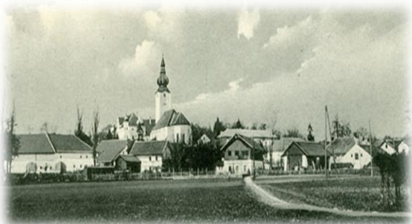
Buchkirchen in alten Ansichten