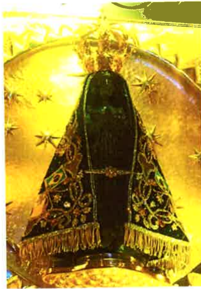
Aparecida: Schwarze Madonna