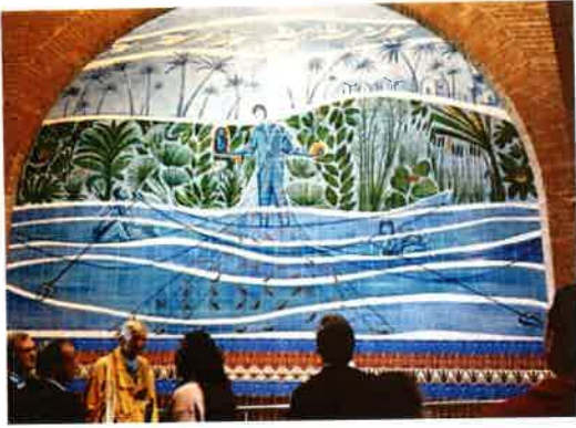
Aparecida: Fischer fangen die Statue