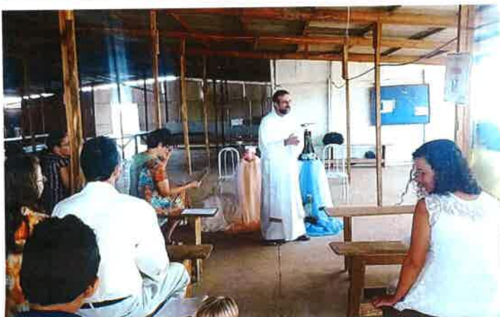
Messe im neuen Viertel Vista Alegre