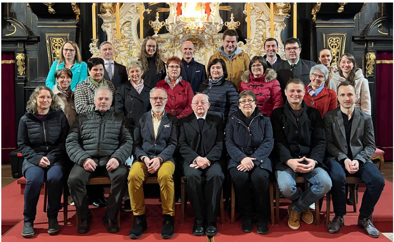
Foto des neuen PGR von der Angelobung - 19.04.2022, Stiftskirche

Nach der Pfarrgemeinderatswahl im März 2022 hat sich der PGR am 19. April konstituiert und anschließend in den 6 Fachteams die konkrete Arbeit neu aufgenommen bzw. fortgesetzt.