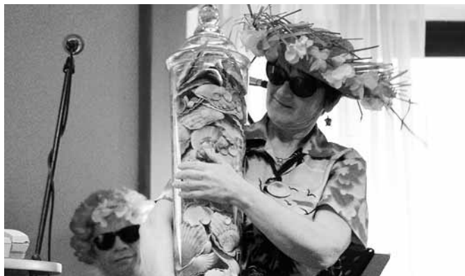
Das Schätzspiel war eine meeresbiologische Herausforderung

Das Tanzbein wurde bei Musik von der „Net-weit-her-Musi“ kräftig geschwungen. Gemeinsam mit den