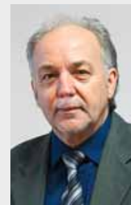
Josef Mayr Niedermayer- weg