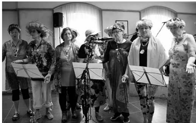
Leitungskreis der Kfb voll in Action