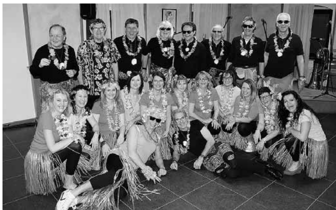
Frauengruppe Mosaik mit Trainern