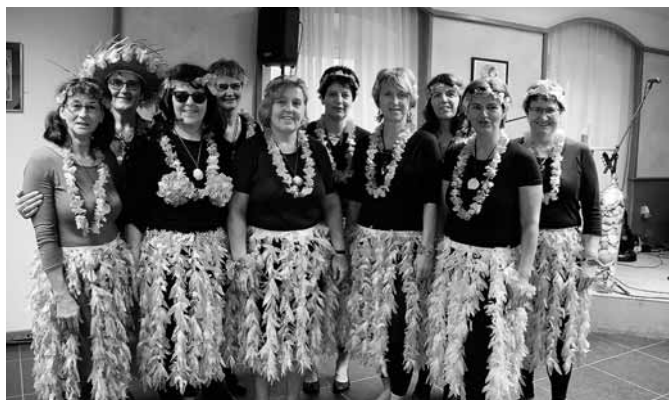
Die Damen vom Frauentreff mit Südseeoutfit und Hula-Laune