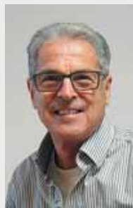
Johann Kern Färberweg