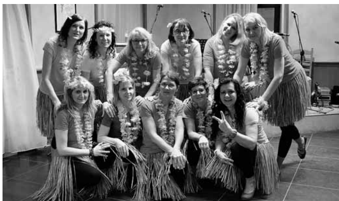
Tanztruppe Mosaik – direkt aus der Südsee