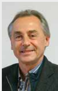
Kurt Auer Hofstätte