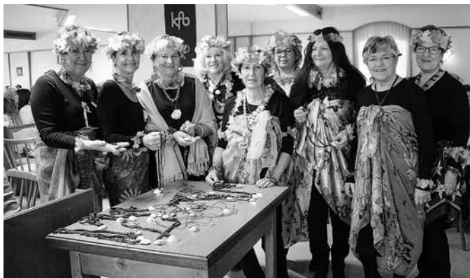
Selbst gebastelte Damenspenden – Kaurimuscheln als Eintritt?

Beim heurigen Frauenfasching der Kfb freute sich die organisierende Gruppe Frauentreff über einen voll gefüllten Saal im Gasthaus Reingruber. Die kreativen Kostümierungen der Besucherinnen unter dem Motto „Südseeträume“ ließen ein richtiges Südseefeeling aufkommen. Durch die dazupassenden Damenspenden und Tischdekorationen wurde dieses Flair perfekt.