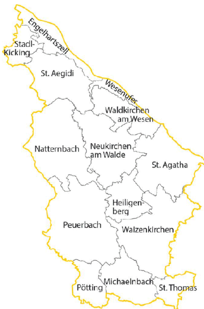
Derzeitiges Dekanat Peuerbach

Für das jetzige Konzept heißt es ernst zu nehmen, dass mit der Taufe der konkrete Mensch Jesus Christus wie ein Gewand angezogen hat (Gal 3,26-28). Aus dieser engen Beziehung zu Jesus Christus heraus für Menschen Räume für die Begegnung mit Gott zu schaffen, anderen zu erzählen, wie der eigene Glaube Halt gibt und ebenso Menschen in ihren Notlagen zu unterstützen. Letztlich will